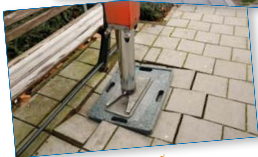
Let op: draagkracht ondergrond