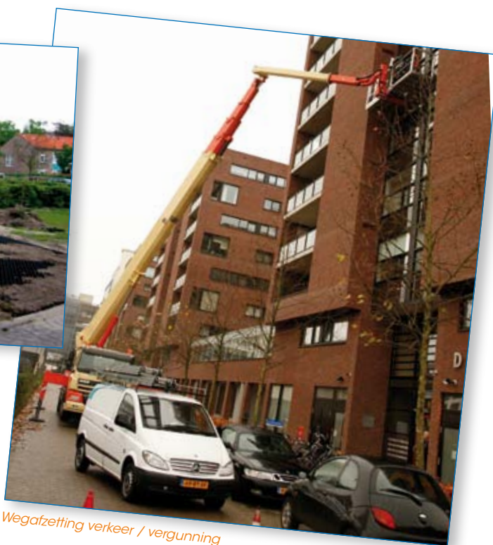
Wegafzetting verkeer / vergunning