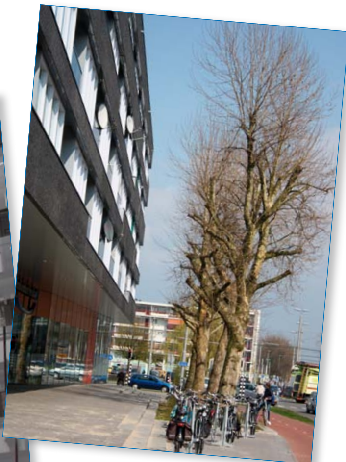
Let op: straatmeubilair