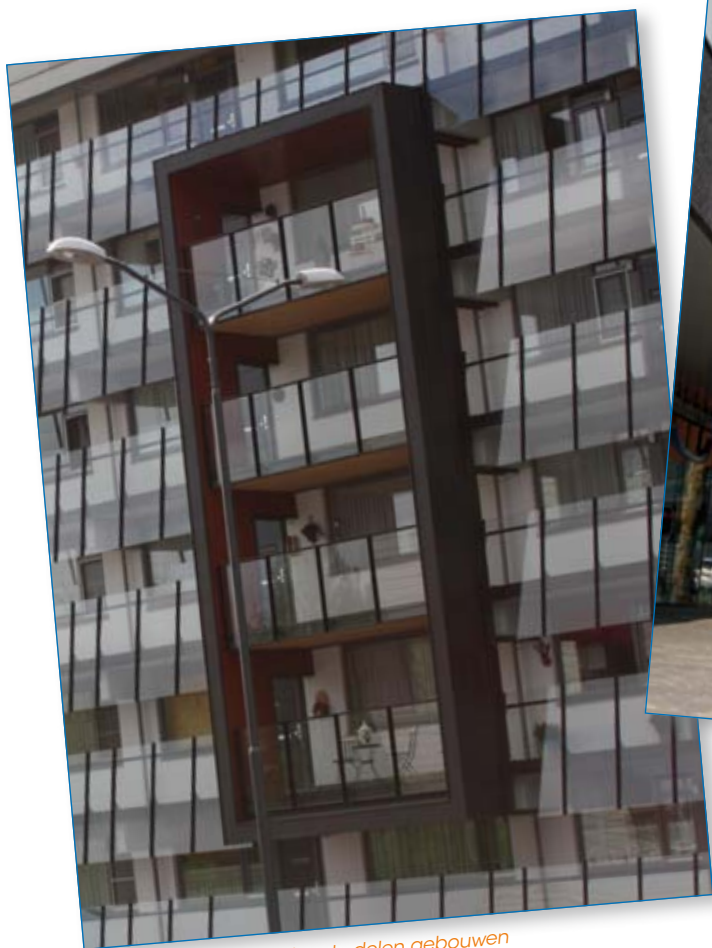
Let op: neggen / uitstekende delen gebouwen